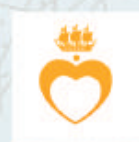
ФГБУ «НМИЦ ИМ. В.А.АЛМАЗОВА» МИНЗДРАВА РОССИИ