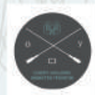
СЕВЕРО-ЗАПАДНОЕ ОБЩЕСТВО УРОЛОГОВ