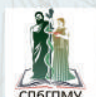
ФГБОУ ВО СПбГМУ МИНЗДРАВА РОССИИ